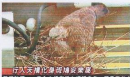
■一隻斑鳩在行人天橋築巢生仔，惹來市民圍觀。

有斑鳩在黃大仙龍翔廣場與黃大仙中心之間的行人天橋築巢生仔，日前來吸引大批市民圍觀，更有市民帶同飼養的山羊到場，最後被領匯人員勸離離開。由於斑鳩母一度長期「失蹤」，令人懷疑牠被市民嚇怕而「棄嬰不顧」，幸斑鳩母最終也飛回巢繼續哺雛鳥。領匯爲保護斑鳩家庭，昨日決定按漁護署的意見在玻璃上貼上單鏡反光紙，令斑鳩免受騷擾。